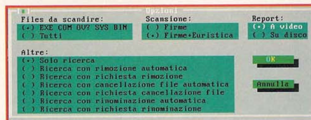
Le opzioni di VirIT