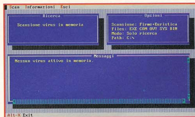
Un esempio di esecuzione